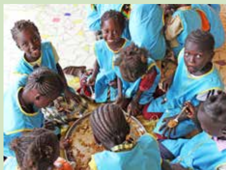
Etensijd voor de kindjes van Les Cajoutiers